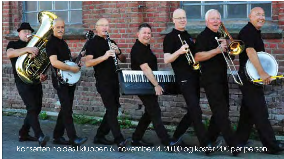
Konserten holdes i klubben 6. november kl. 20.00 og koster 20€ per person.

Dixieland orkesteret Gyldenløve Brygge Swing Ensemble har de siste to årene turnert litt sør for oss i Marbella/ Malaga området. Flere av klubbens medlemmer har hørt orkesteret på lørdagsjazz i jazz-klubber rundt på Østlandet og har spurt om de ikke kunne legge turen innom. Vi er derfor glade for å fortelle at de vil holde en konsert i DNKCBs klubblokaler i høst mandag 6. november.